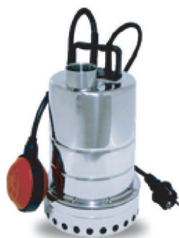
FC 50 / 32