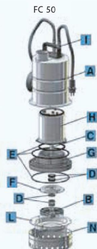
TABELLA MATERIALI / MATERIALS TABLE: