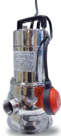
FC 100 / 50 FC 150 / 50 FC 200 / 50